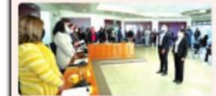
ENSENADA.- Aprobaron regidores de Ensenada la realización de diversas obras, como parte del programa de inversión social de Energía Costa Azul.

ENSENADA.- El pleno del Cabildo aprobó, por mayoría de votos, la autorización para la realización de obras de rehabilitación, construcción, modernización, remodelación y/o adecuación de proyectos integrales diversos de mejoramiento