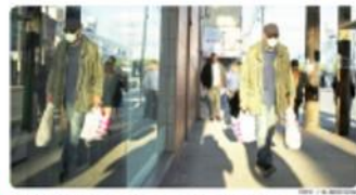
MEXICALI.- A un año de que la pandemia llegó a Baja California, la lucha del sector salud continúa.