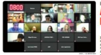
MEXICALI.- Un segundo convenio será con la Fiscalía en Delitos Electorales y el Tribunal de Justicia Electoral.